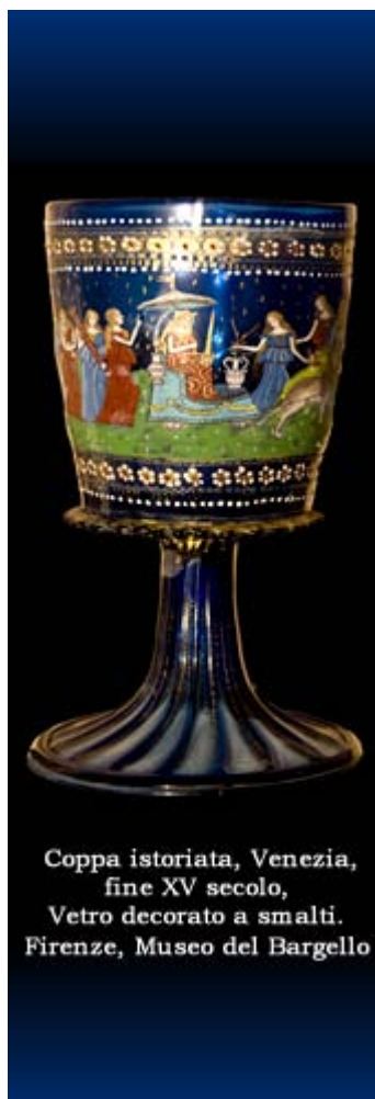
Coppa istoriata, Venezia, fine XV secolo, Vetro decorato a smalti. Firenze, Museo del Bargello

Le lezioni e la discussione si terranno in lingua inglese; gli interventi che saranno presentati in lingua italiana verranno tradotti in inglese dai curatori dei seminari.