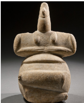
Statuetta femminile seduta con gambe piegate Cicladi, forse Amorgos Neolitico Tardo (V-IV millennio) Marmo Bruxelles. Musées Royaux d'Art et d'Histoire

Le più antiche testimonianze di scultura nel mondo greco risalgono al Neolitico. I materiali utilizzati erano molti e includevano terracotta, osso, conchiglia e pietra. Le rappresentazioni vanno dall'estremamente astratto (ciottoli) al realismo molto più accentuato. Questa scultura in marmo, ben conservata, è tra gli esemplari più raffinati di una categoria molto rara e presenta linee semplici e forme geometriche nitide che trovano richiami sorprendenti nell'arte del XX secolo. Rappresenta una figura femminile seduta con le gambe piegate una sopra l'altra anziché incrociate. La parte superiore del corpo è un ampio rettangolo piatto inclinato all'indietro rispetto alla porzione inferiore. I seni, ben definiti, sembrano pendere da entrambi i lati del collo. La parte inferiore del corpo è una massa molto arrotondata con natiche estremamente accentuate separate da un solco. Recenti scavi effettuati in Grecia hanno portato alla luce altre figurine neolitiche, principalmente in terracotta. Esse dimostrano che le raffigurazioni antropomorfe, in particolare quelle femminili, erano comuni nel mondo greco dell'epoca, evidenziando le varianti regionali di stile e posa. In realtà la posizione a gambe incrociate, o apparentemente incrociate, è attestata soprattutto nelle Cicladi e forse in Attica, il che porta a confermare che la scultura, acquistata dal Museo di Bruxelles nel 1929 da Manolis Segredakis, noto mercante d'arte cretese attivo a Parigi, proviene effettivamente dalle isole.