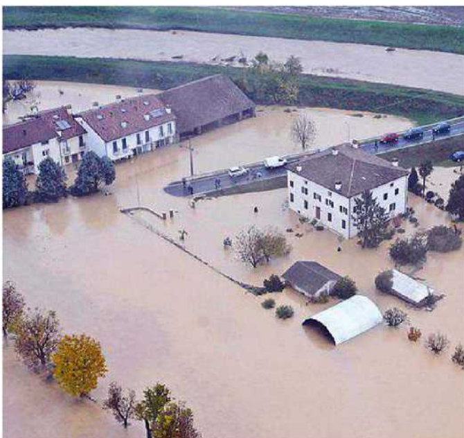
Un'immagine aerea di Caldogeno durante l'alluvione del 2 novembre 2010